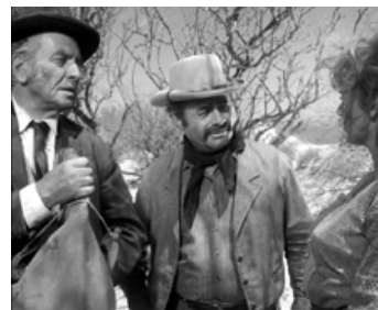
1967 HOMBRE (Hombre) de Martin Ritt avec Martin Balsam, Diane Cilento