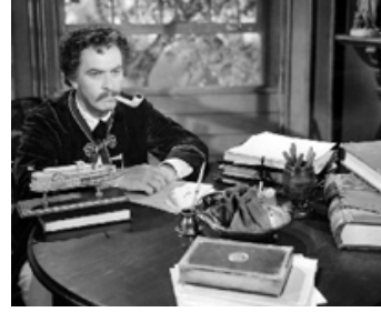
1944 LES AVENTURES DE MARK TWAIN (The Adventures of Mark Twain) d'Irving Rapper