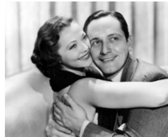
1934 GOOD DAME (Good Dame) de Marion Gering avec Sylvia Sydney