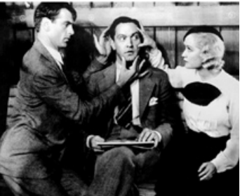
1933 SÉRÉNADE À TROIS (Design for Living) d'E. Lubitsch avec Gary Cooper, M. Hopkins