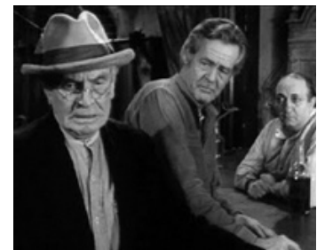
1973 THE ICEMAN COMETH de John Frankheimer avec Robert Ryan