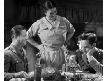
1933 L'AIGLE ET LE VAUTOUR (The Eagle and the Hawk) de Stuart Walker avec Jack Oakie