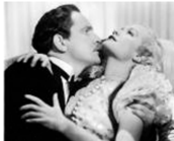
1934 ALL OF ME de James Flood avec Miriam Hopkins