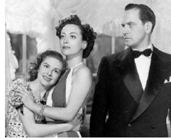
1940 SUZANNE ET SES IDÉES (Susan and God) de George Cukor avec Joan Crawford