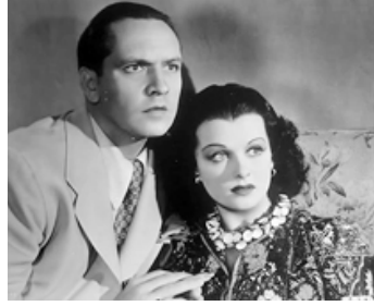
1938 LA FEMME AUX CIGARETTES BLONDES (Trade Winds) de Tay Garnett avec Clara Bow