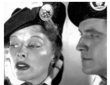
1936 MARY STUART (Mary of Scotland) de John Ford avec Katharine Hepburn