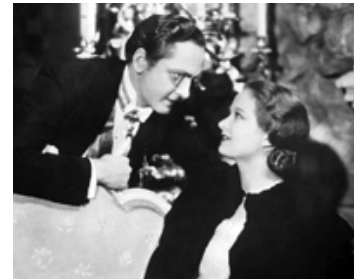
1934 LA MORT PREND DES VACANCES (Death takes a Holiday) de M. Leisen avec E. Venable