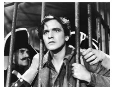
1935 LES MISÉRABLES (Les Miserables) de Richard Boleslawski