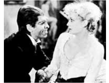
1931 DR JEKYLL ET M. HYDE (Dr Jekyll and Mr Hyde) de R. Mamoulian avec Myriam Hopkins