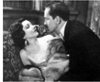
1931 HONOR AMONG LOVERS de Dorothy Arzner avec Claudette Colbert