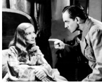
1942 MA FEMME EST UNE SORCIÈRE (I married a Witch) de René Clair avec Veronica Lake