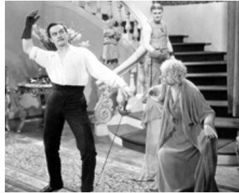
1930 THE ROYAL FAMILY OF BROADWAY de George Cukor avec Ina Claire