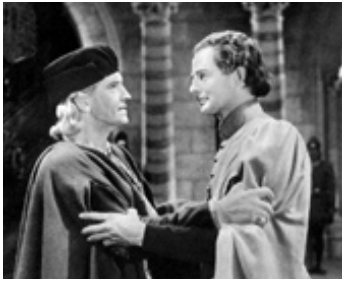
1949 CHRISTOPHE COLOM (Christopher Columbus) de David Macdonald avec Derek Bond