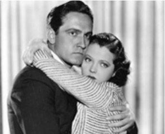
1933 MERRILY WE GO TO HELL de Dorothy Arzner avec Sylvia Sydney