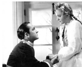
1934 RÉSURRECTION (We live again) de Rouben Mamoulian avec Anna Sten