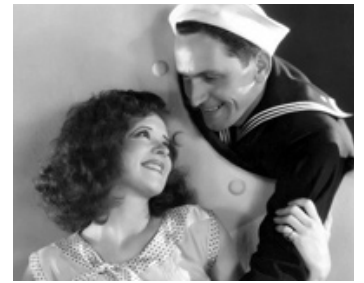
1930 TRUE TO THE NAVY de Frank Tuttle avec Clara Bow