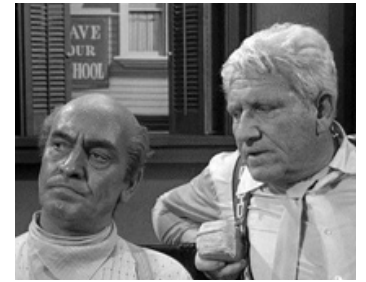
1960 PROCÈS DE SINGE (Inherit the Wind) de Stanley Kramer avec Spencer Tracy