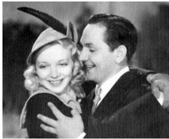
1938 LE PAUVRE MILLIONNAIRE (There goes my Heart) de N. McLeod avec Virginia Bruce