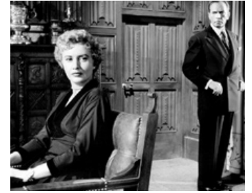
1954 LA TOUR DES AMBITIEUX (Executive Suite) de Robert Wise avec Barbara Stanwyck