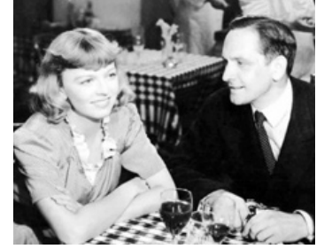
1941 SO ENDS OUR NIGHT de John Cromwell avec Margaret Sullavan