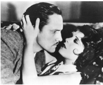
1929 LES ENDIABLÉES (The Wild Party) de Dorothy Arzner avec Clara Bow