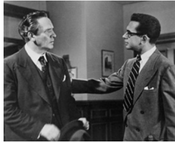
1951 MORT D'UN COMMIS-VOYAGEUR (Death of a Salesman) de L. Benedek avec Don Keefer