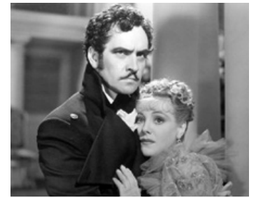
1938 LES FLIBUSTIERS (The Buccaneer) de Cecil B. De Mille avec Margot Grahame