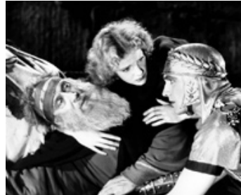
1932 LE SIGNE DE LA CROIX (The Sign of the Cross) de Cecil B. De Mille avec Elissa Landi