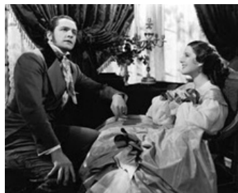
1934 MISS BA (The Barretts of Wimpole Street) de Sidney Franklin avec Norma Shearer