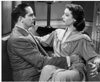
1941 J'ÉPOUSE MA FEMME (Bedtime Story) d'Alexander Hall avec Loretta Young