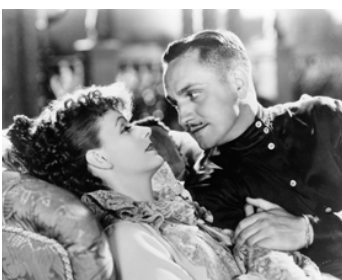
1935 ANNA KARÉNINE (Anna Karenina) de Clarence Brown avec Greta Garbo