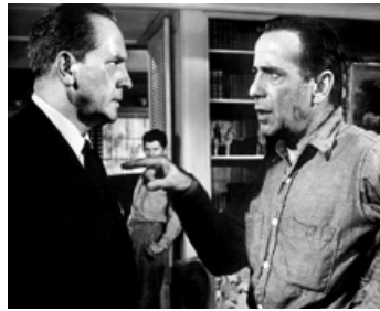
1955 LA MAISON DES OTAGES (The Desperate Hours) de W. Wyler avec Humphrey Bogart