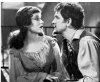
1934 LES AMOURS DE CELLINI (The Affairs of Cellini) de Gregory La Cava avec Fay Wray