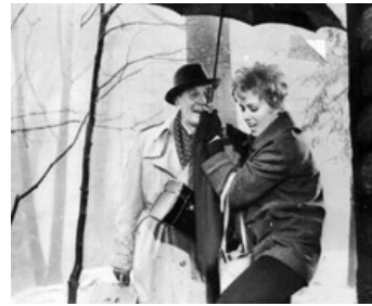
1959 AU MILIEU DE LA NUIT (Middle of the Night) de Delbert Mann avec Kim Novak