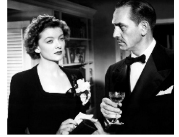
1944 LES PLUS BELLES ANNÉES DE NOTRE VIE (The Best Years of our Lives) de W. Wyler avec Myrna Loy