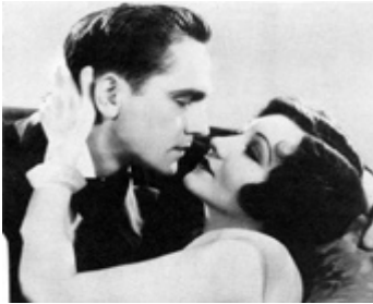
1930 UNE BELLE BRUTE (Manslaughter) de George Abbott avec Claudette Colbert