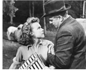
1953 MAN ON A TIGHTROPE d'Elia Kazan avec Gloria Grahame