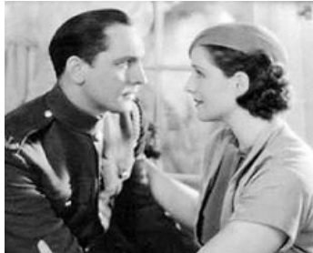
1932 SMILIN' THROUGH de Sidney Franklin avec Norma Shearer