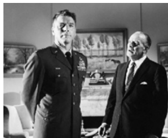
1964 SEPT JOURS EN MAI (Seven Days in May) de J. Frankheimer avec Burt Lancaster