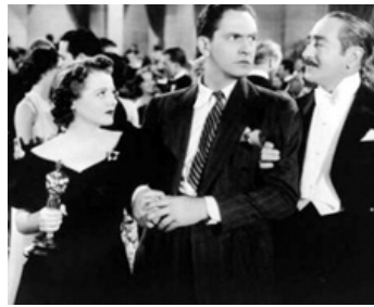
1937 UNE ÉTOILE EST NÉE (A Star is born) de William Wellman avec Janet Gaynor