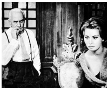
1962 LES SÉQUESTRÉS D'ALTONA (I Sequestrati di Altona) de Vittorio De Sica