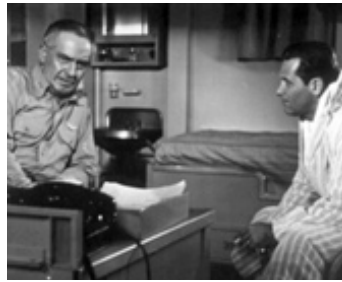
1955 LES PONTS DE TOKO-RI (The Bridges at Toko-Ri) de Mark Robson avec William Holden