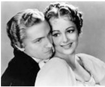
1936 ANTHONY ADVERSE (Anthony Adverse) de Mervyn LeRoy avec Olivia de Havilland