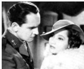
1935 L'ANGE DES TÉNÈBRES (The Dark Angel) de Sidney Franklin avec Merle Oberon